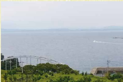
水俣市月ノ浦から不知火海を望む