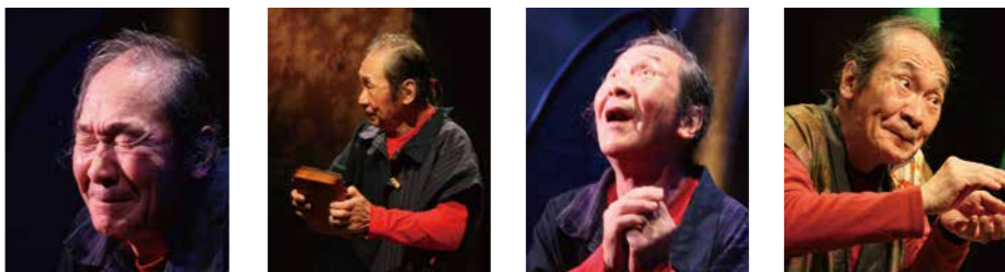
― 第五章「紐とき寒行」より ―

1952年東京生まれ。1979年より劇団転形劇場（太田省吾 主宰）に所属。名作水の駅「小町風伝」などで、日本および海外各地の舞台を踏む。1990年より劇団U・ワールドを主宰。構成・演出をつとめる。同劇団解散後、2013年より文学作品を一人で舞台化する「朗読演劇」を開始。チャールズ・ブコウスキーの『町でいちばんの美女』カフカの『変身』で好評を得る。2018年より石牟礼道子「椿の海の記」全十一章の連続上演を開始。三年をかけて全十一章の上演を果たした後、現在その全国行脚公演を遂行中。