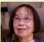
石牟礼道子 Michiko Ishimine / 詩人・作家 (1927～2018年)

そして最終場面、夜の冬の町をさまよう盲目の祖母・おもかさまと、祖母に寄り添う四歳の道子みっちゃんの頭上に粉雪が舞い降りて……静かな静かな感動が舞台と客席を包み込んでまいります。